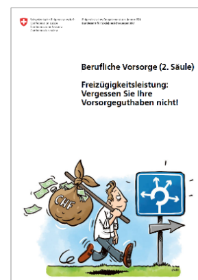
Verbreitung der Broschüre «Freizügigkeitsleistung, Vorsorge» Anzahl Exemplare Print und elektronisch je Sprache (April 2018 – Oktober 2019)

In der folgenden Tabelle sind die Anzahl gedruckter Broschüren sowie die Zugriffe auf die pdf-Dateien via die Webseite des BSV 4 zwischen April 2018 und Oktober 2019 ersichtlich, geordnet nach den neun Sprachen.